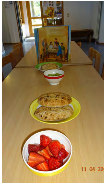
Die lange Tafel (Fotos privat)

tensives Empfinden und wir genossen den Augenblick mit den Kindern sehr.