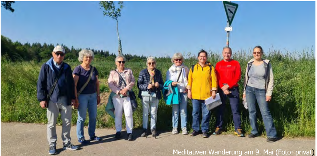
Meditativen Wanderung am 9. Mai

Bitte dem Wetter angepasste Kleidung und gutes Schuhwerk, Stöcke, Getränke, Snacks bzw. alles für den persönlichen Bedarf mitbringen. Bei extrem schlechtem Wetter und großer Hitze findet ein meditativer Impuls in der Gustav-Adolf-Kirche bzw. im Kirchgarten statt.