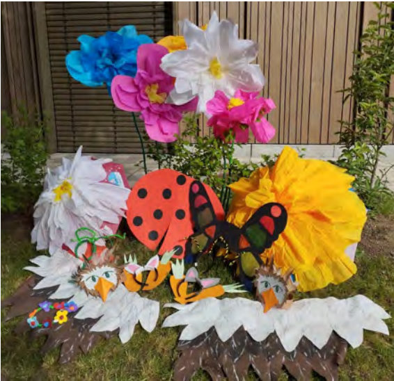
Die Kostüme nach getaner Arbeit

Nach langen, grauen Wintertagen durften wir in unserer evangelischen Kita Himmelszelt endlich den Frühling begrüßen und das auf ganz besondere Weise: mit unserem diesjährigen Frühlingsfest!