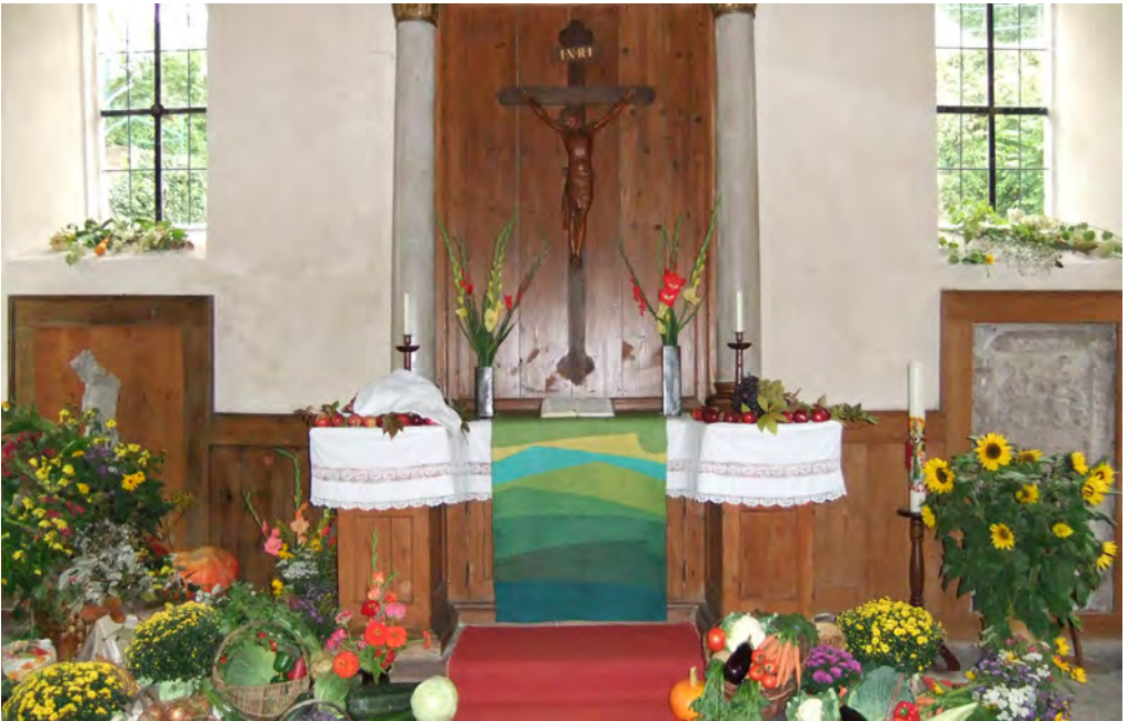
So bunt geschmückt ist die Schlosskirche in Obergrombach nur am Erntedankfest

Am Sonntag, 05. Oktober um 10:30 Uhr treffen wir uns in der Schlosskirche in Obergrombach. Wir feiern in diesem Gottesdienst auch das Abendmahl, teilen Brot und den Saft der Trauben in Erinnerung an Jesus, Weg, Wahrheit, Leben.