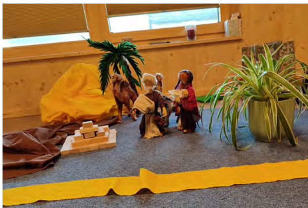
Flucht nach Ägypten, Foto: Chelo