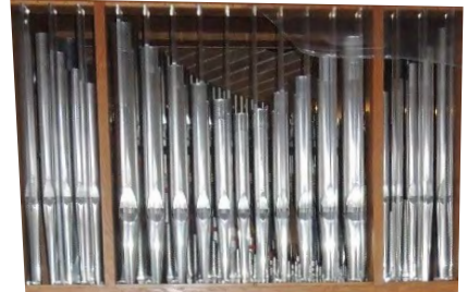
Ein Blick auf die vorderen Pfeifenreihen

Die Kosten der neuen Orgel für Einlagerung, Reinigung und Überholung, sowie Transport und Aufbau der Orgel, Umbaumaßnahmen in unserer