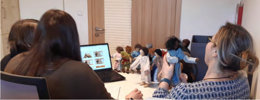
Die Auswahl war gar nicht so einfach....