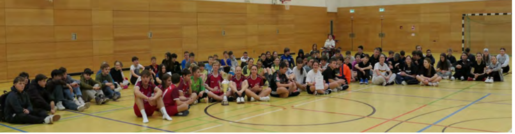
Die Spieler der neun Konfi-Mannschaften aus dem Kirchenbezirk Bretten-Bruchsal

Mit viel Spaß, Motivation und auch einigem Ehrgeiz spielten 90 Konfis in 9 Mannschaften aus allen Teilen des Kirchenbezirkes Bretten-Bruchsal in Sulzfeld um den Sieg. In Gruppenspielen und dann in der Finalrunde zeigten alle Spielenden Mannschaftsgeist und Spielfreude. Auch die mitgereisten Fans feuerten mit viel Begeisterung die Spielenden an. Für einen fairen Ablauf sorgten in gewohnter Weise Schiedsrichter des Badischen Fußballverbandes e.V.