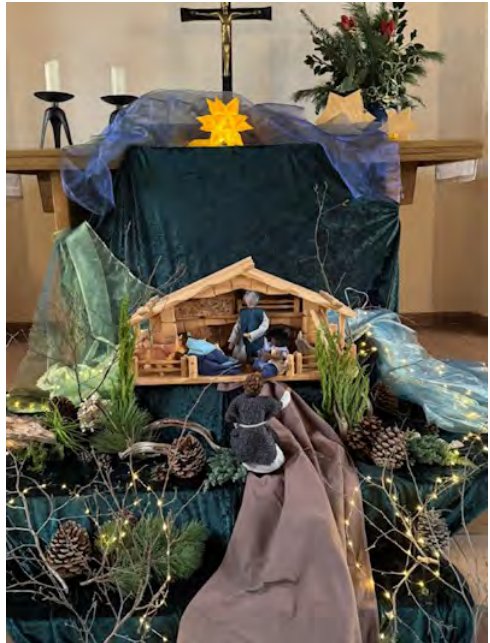
Eine Wintergeschichte, Teil 2 „Angekommen...“

...am 12. Dezember folgte die Fortsetzung in der Gustav-Adolf-Kirche. Die beiden fanden, was sie gesucht hatten - im Stall, beim Kind in der Krippe. Verwandelt machten sich miteinander am nächsten Morgen wieder auf den Heimweg.