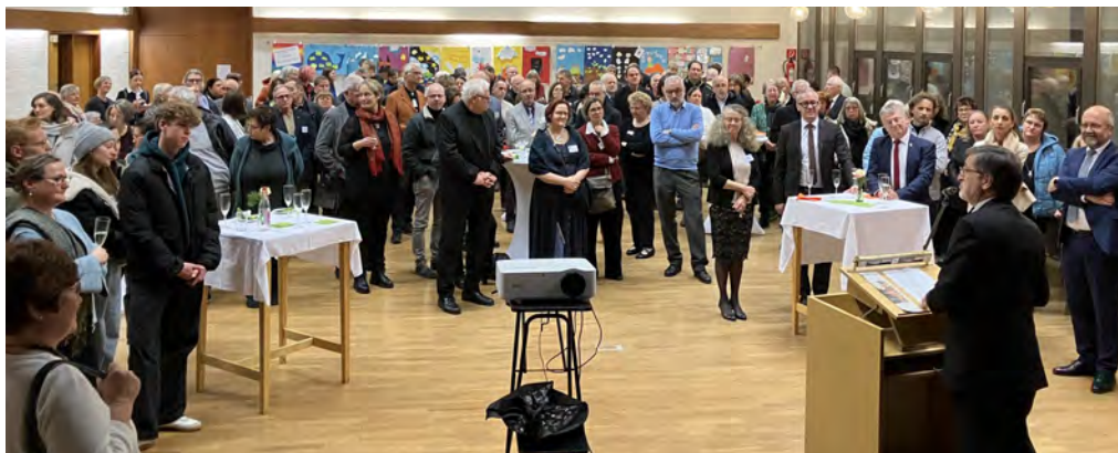
Nach dem Festgottesdienst wurde angestoßen...