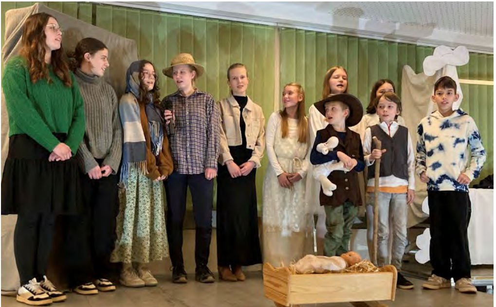
„LichterKinder“- mit diesem Rapp endete das Krippenspiel im kath. Pfarrzentrum in OG