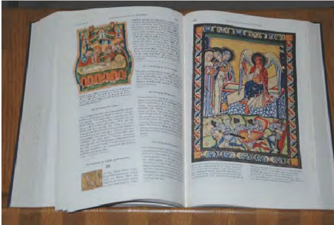
Bibelausgabe Kloster Obermarchtal